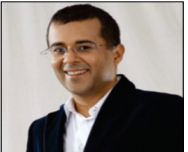
Mr. Chetan Bhagat Author & Motivational Speaker