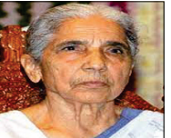
Dr. Smt. Kamla Then Excellency Governor of Gujarat