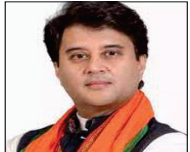
Sh. Jyotiraditya Scindia Union Minister

विद्यार्थियों को बेहतरीन प्रबंधन शिक्षा का अवसर प्रदान कराता है। यहां पर विद्यार्थियों को केस-एनालिसिस, एनालिटिक्स, सेमुलेशन इत्यादि के द्वारा लर्निंग बाई डूइंग के आधार पर प्रबंधन में पारंगत कराया जाता है। विद्यार्थियों में प्रबंध मूल्यों को आत्मसात कराने तथा सर्वांगीण विकास के लिए संस्थान ने हमेशा जोर दिया है। इसी कड़ी में संस्थान में ख्यातनाम हस्तियों को आमंत्रित कर विद्यार्थियों में एक अलख जगाई है ताकि वह उनकी सफलता की कहानी को जान सकें व अपने जीवन में उतारने का प्रयत्न कर सकें। जिनमें से कुछ प्रमुख हस्तियां निम्न हैं -